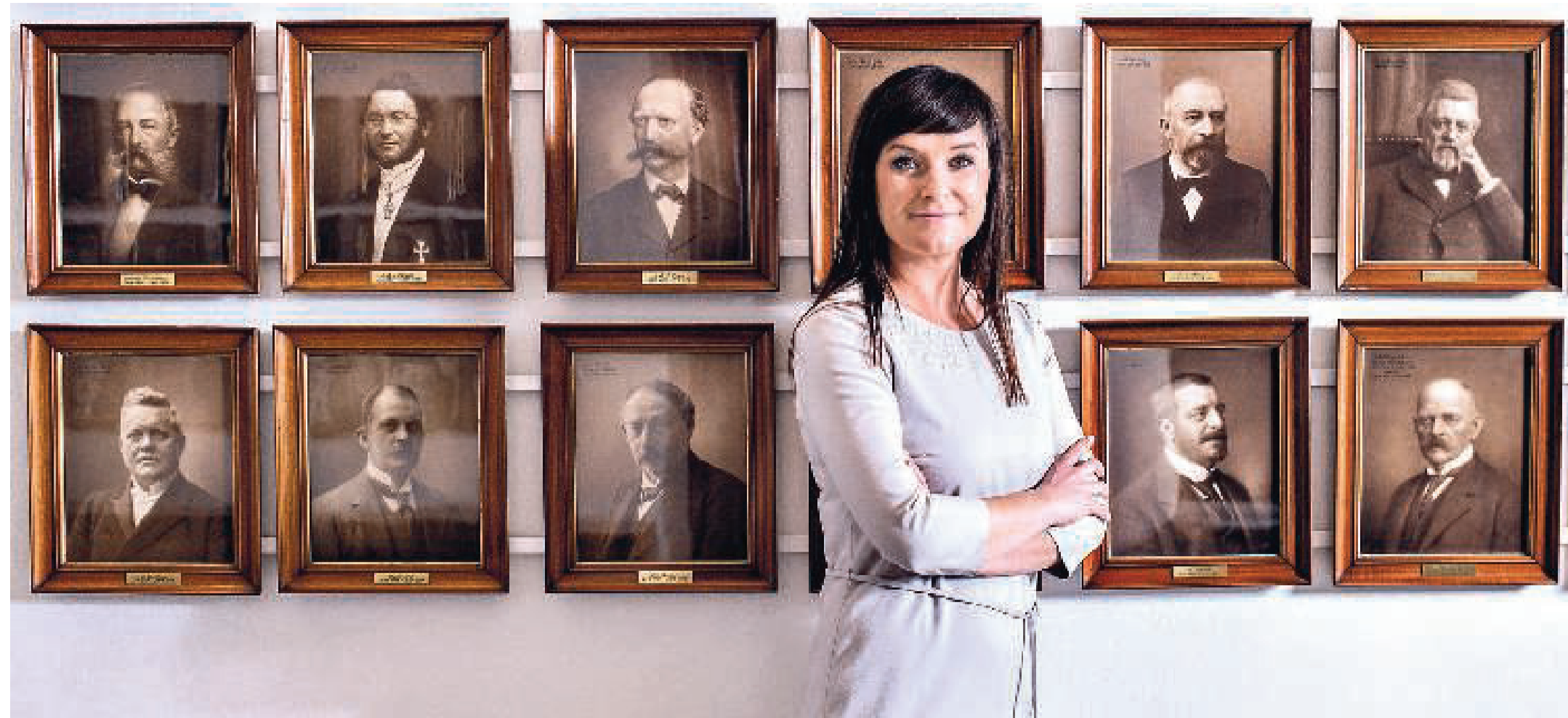
Innovationsminister Sophie Løhde: »I dag spilder det offentlige mange penge, fordi man ikke køber kloget nok ind. Formentlig drejer det sig om milliarder af kroner hvert år.«

Et lyspunkt for SOSU'erne er dog, at de ligger relativt højt i statistikken fra Det Nationale Forskningscenter for Arbejdsmiljø, når det gælder arbejdsglæde, mening med arbejdet og engagement. Noget tyder altså på, at selve SOSU'ernes kerneopgaver ikke er problemet, men blot omverdens nedprioritering af dem.